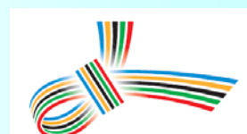
当委員会活動ロゴ「結び」

(当委員会ホームページ: http://www.tokyo-sc.or.jp/ )